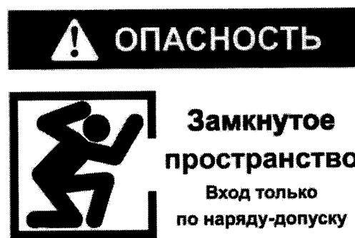
Рекомендуемый знак «ОЗП».

2. Объекты, вошедшие в Перечень 1 и не являющиеся территориально обособленными объектами, должны быть обозначены знаком «ОЗП» (рекомендуемый текст).